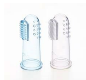
Brosse à dents de doigt